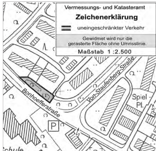
Übersichtsplan Nr. 2

Gemäß § 6 (1) Straßen- und Wegegesetz NRW wird das im Eigentum der Stadt Münster stehende Teilstück der Bonhoefferstraße an der Einmündung der Von-Staufenberg-Straße dem öffentlichen Straßenverkehr gewidmet.