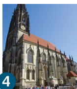
4 Церква Святого Ламберті