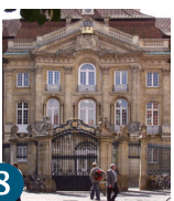
8 Подвір'я Erdrostenhof