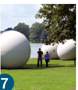
7 Озеро Aasee