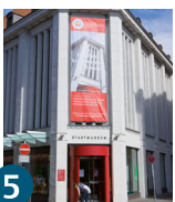
5 Міський музей