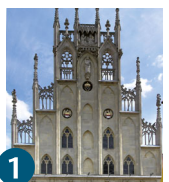
1 Історична ратуша