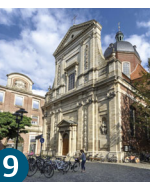
9 Домініканська церква