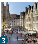
3 Вулиця Prinzipalmarkt