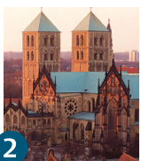
2 Собор Святого Павла