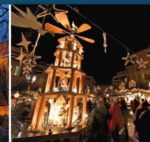
Harsewinkelplatz Harsewinkelplatz 27.11.–23.12.