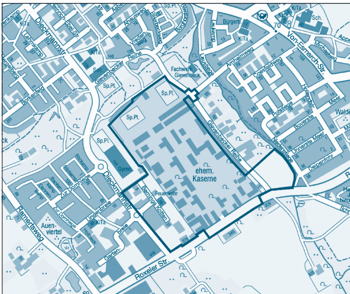
Übersichtsplan Nr. 1 Bereich des Bebauungsplans Nr. 579

Gemäß dem Baugesetzbuch (BauGB) wurde für den oben bezeichneten Teil des Stadtgebiets der Entwurf des Bebauungsplans Nr. 579 nebst Begründung aufgestellt.