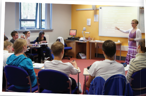
Over 30 hours teaching in small classes.

Außerdem bieten wir zahlreiche Sport- und Abendveranstaltungen, so dass bestimmt keine Langeweile aufkommt und die Jugendlichen fast rund um die Uhr betreut sind. Dabei ist es uns wichtig, dass die Teilnehmer so oft wie möglich aus verschiedenen Freizeitangeboten wählen können, um verschiedenen Interessen gerecht zu werden. Wir unterscheiden deshalb zwischen Gruppenaktivitäten für alle Teilnehmer (diese beinhalten z.B. alle Ausflüge) und wählbaren Aktivitäten.