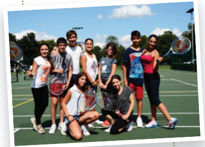
Fancy a game of tennis on Bootham School's tennis courts?