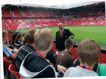
Manchester United Football Club