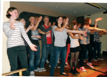
Club Night...We can dance!