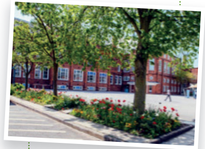
Bootham School... Hogwarts!!