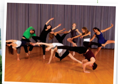
Fancy dance dance in Bootham School's dance studio?