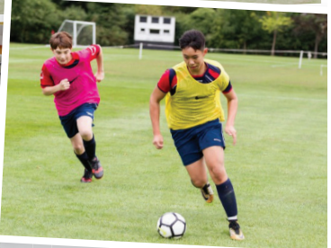
Fancy a game of football on Bootham School's pitches?