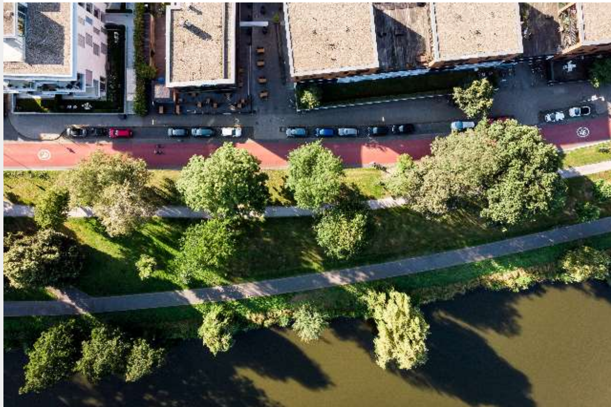
Fahrradstraße Bismarckallee