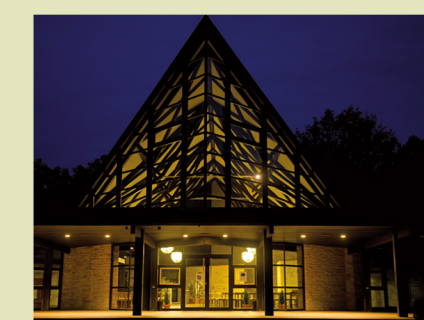
Feierhalle auf dem Waldfriedhof Lauheide

Alle städtischen Friedhöfe sind ganzjährig täglich von Sonnenaufgang bis Sonnenuntergang geöffnet.