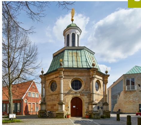
Telgte - Wallfahrtskapelle