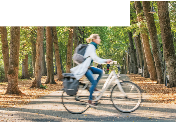
Münster - Promenade