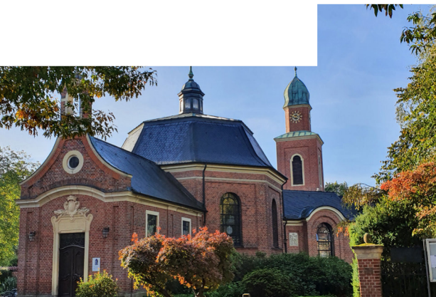
Münster - Dyckburgkirche