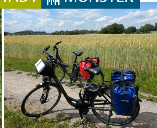
Unterwegs mit dem Fahrrad